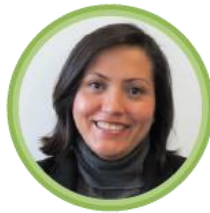
Monserrat Urusquieta Directora General de Concesiones de Radiodifusión 1 entrevista